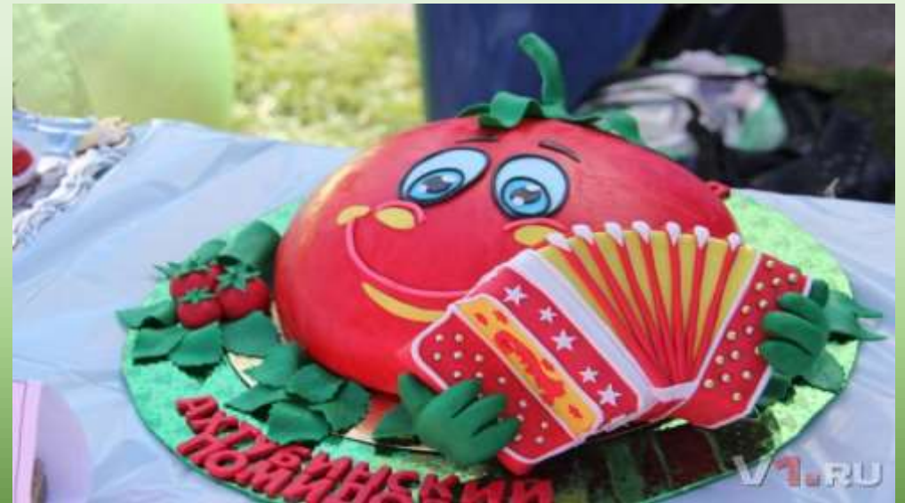
На фото: Фестиваль «Ахтубинский помидор»